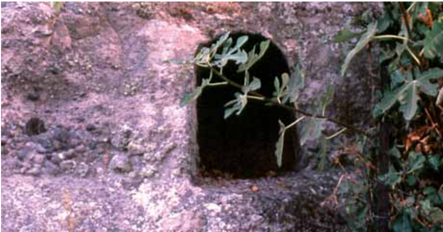
Αρχαία κόχη πλυσίων του χωριού

Στη θέση Άγιος Αλέξης στο Αλωνίτσι έχουν βρεθεί λείψανα από προϊστορικό οικισμό της πρώιμης εποχής του Χαλκού (3000 π.Χ. περίπου). Στον λόφο του Αγίου Μηνά ανάμεσα από τους δύο χειμάρους έχουν ανακαλυφθεί λείψανα αρχαίας πόλης των κλασικών χρόνων και μεταγενέστερα. Στην Εβραϊκή ή Εβραϊόκαστρο λείψανα από αρχαία νεκρόπολη αλλά και μαρμάρινη επιγραφή στα Εβραϊκά. Επίσης έχει βρεθεί και τεράστιας σημασίας γεωλογικό μνημείο, το απολιθωμένο δάσος. Αυτό δεν είναι κάτι περίεργο μια που η Λέσβος με το περίφημο απολιθωμένο