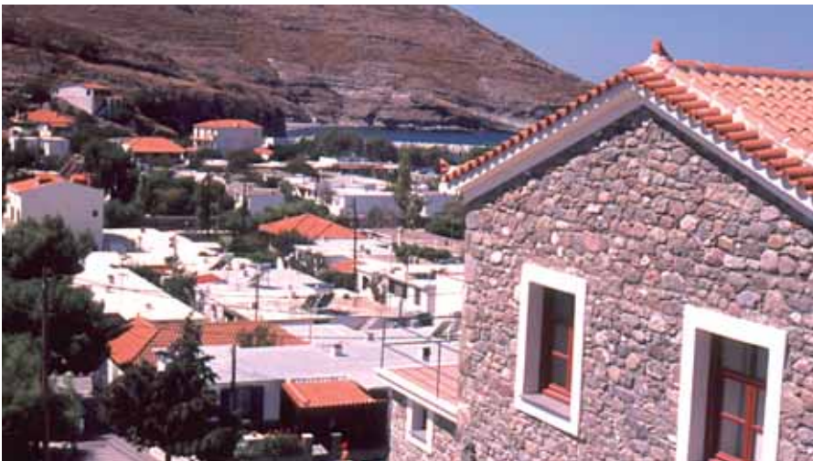
Μουσείο Δημοκρατίας: στεγάζεται στο κτίριο που οι εξόριστοι χρησιμοποιούσαν σαν αναρρωτήριο.

Ο Αη-Στράτης και οι κάτοικοι του αδικήθηκαν από την πρόσφατη ιστορία. Στο πανελλήνιο το νησί έγινε γνωστό ως τόπος εκτοπισμού, ως τόπος εξορίας. Από το 1928 και για 35 χρόνια μέχρι το 1963 χιλιάδες αγωνιστές, δημοκράτες και κομμουνιστές, εξορίστηκαν για τις ιδεολογικές τους απόψεις και για τη δράση τους.