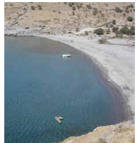
Παραλία Φτελιό

Ο Σύλλογος των Απανταχού Αγιοευστραπιτών "Ο ΑΓΙΟΣ ΕΥΣΤΡΑΤΙΟΣ" σε συνεργασία με το νοσοκομείο "Γ. Γεννηματάς" προτίθεται να πραγματοποιήσει εθελοντική αιμοδοσία στον Άγιο Ευστράτιο στις 10 Αυγούστου με σκοπό να ιδρυθεί Τράπεζα Αίματος για τους Αγιοστραπίτες. Δώσε και σύ αίμα. Σώστε ζωές.