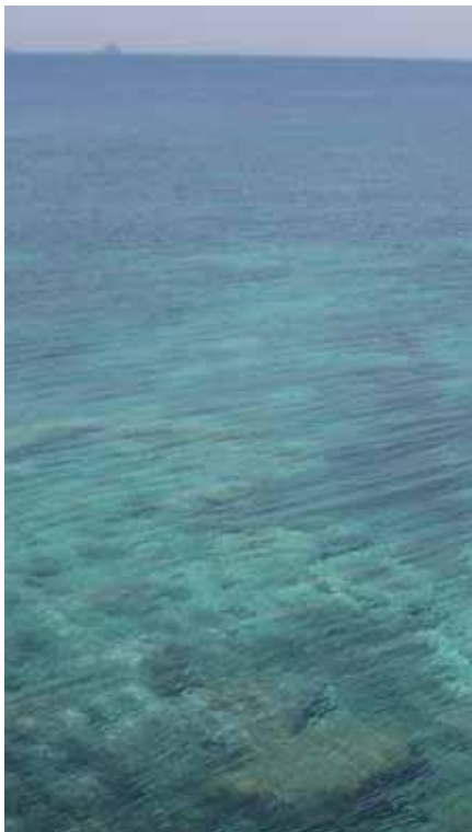
Γαλάζοπράσινα νερά

Αυτές οι λίγες μέρες που αφιερώνουμε στο αγαπημένο μας σπορ στο νησί κάθε καλοκαίρι, μας γεμίζουν τις μπαταρίες για τις ατελείωτες ώρες δουλειάς στην πρωτεύουσα. Μετά από 20 χρόνια ψαρέματος έχω φτάσει στο σημείο να φιλοσοφήσω την έννοια του ψαροντούφεκου. Οι μεγάλες ψαριές, η εξάντληση για την επίτευξή τους, ο ανταγωνισμός για το ποιός θα πιάσει το μεγαλύτερο ή τα περισσότερα ψάρια έχουν περάσει ανεπιστρεπτή. Η θάλασσα έχει κουραστεί να δίνει. Εμείς, και εννοώ οι ψαροντουφεκάδες αλλά και όλοι οι ερασιτέχνες ψαράδες, σαν ευσυνειδητοί λάτρεις της φύσης, θα πρέπει να στρέψουμε το ενδιαφέρον μας στο να βιώσουμε και να απολαύσουμε ότι έχει απομείνει από αυτό το μεγάλο.