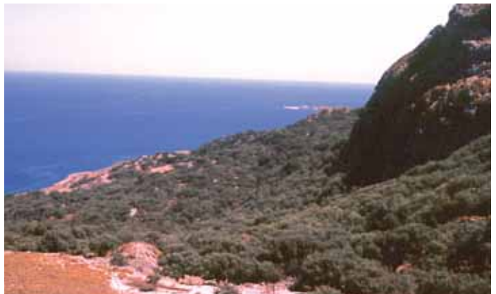
Δασωμένη πλαγιά στην περιοχή "Αυλάκια"

Για όλα αυτά, όμως, για την προστασία του τόπου και τις προοπτικές που δίνει το πρόγραμμα θα επανέλθουμε σε επόμενο τεύχος.