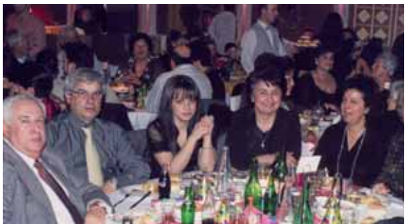
Ο Πρόεδρος της Κοινότητας με την οικογένειά του τίμησε με την παρουσία του το φετινό χορό.

Έχει καθιερωθεί πλέον μια φορά το χρόνο να μαζευόμαστε στην Αθήνα για να φάμε, να πιούμε και να γλεντήσουμε, όπως εμείς οι νησιώτες ξέρουμε καλά. Ο ετήσιος αυτός χορός πραγματοποιείται με μεγάλη επιτυχία για 12η συνεχή χρονιά.