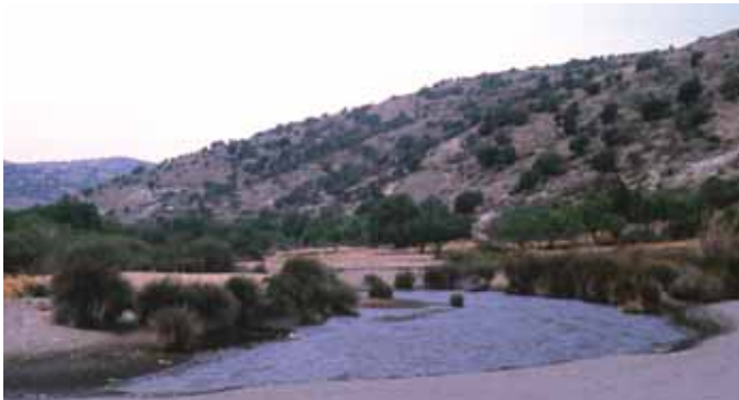
Παραλία Αγίου Δημητρίου

Το Ευρωπαϊκό Οικολογικό Δίκτυο Natura 2000 που δημιουργήθηκε μετά από Οδηγία της Ευρωπαϊκής Ένωσης είναι ένα πρόγραμμα για την καταγραφή, την αναγνώριση, την εκτίμηση και την χαρτογράφηση των φυσικών τόπων οικολογικού ενδιαφέροντος και των ειδών της χλωρίδας και της πανίδας. Στην Ελλάδα έχουν προσδιοριστεί και καταγραφεί 239 περιοχές που ονομάζονται Τόποι Κοινοτικής Σημασίας (Τ.Κ.Σ) με στόχο να προστατευτεί η βιοποικιλότητα, δηλαδή η προστασία της ιδιαίτερης ποικιλίας των φυτών και των ζώων αλλά και του κάλους της περιοχής ως φυσικού τόπου. Ο Άγιος Ευστράτιος η παράκτια και η θαλάσσια ζώνη του είναι πλέον μία προστατευόμενη περιοχή, ένας δηλαδή από τους 239 αυτούς τόπους. Η έκταση της προστατευόμενης περιοχής του νησιού μας έχει προσδιοριστεί μαζί με 12% θαλάσσιας ζώνης στα 6.283 ha.