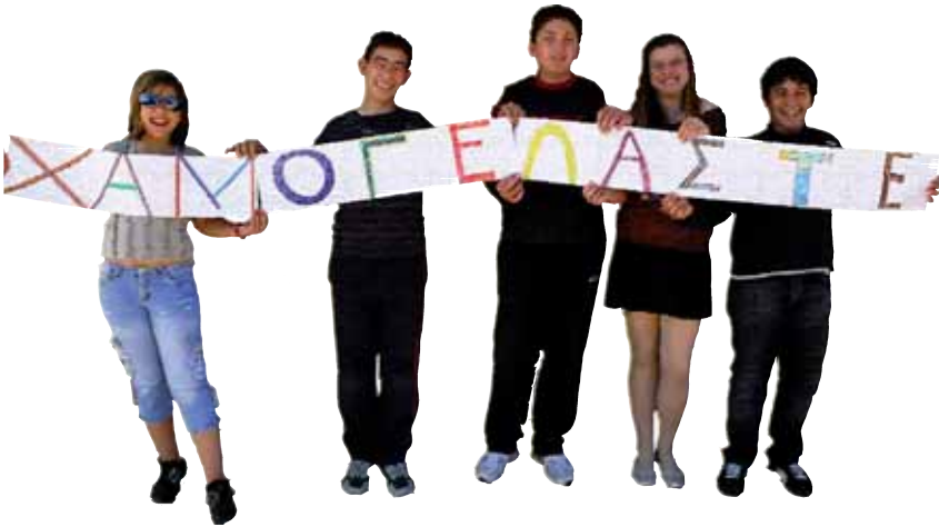
Οι πέντε μαθητές - δημιουργοί του www.xamogelaste.blogspot.com

Οι “Χαμογελάστε!!” είναι μία ομάδα μαθητών του Γυμνασίου Αγίου Ευστρατίου που εδώ και δύο χρόνια χρησιμοποιεί τη φωτογραφία και το διαδίκτυο για να γράφει και να δημοσιεύει σχετικά με τη ζωή στον Άη- Στράτη. Είναι μία προσπάθεια δημιουργικής ενασχόλησης των παιδιών και προώθησης της δικής τους ματιάς πάνω στην ιδιαιτερότητα του να ζεις σε ένα μέρος όπως ο Άη-Στράτης. Τα πέντε παιδιά που εδώ και δύο χρόνια διατηρούν το ιστολόγιο στη διεύθυνση www.xamogelaste.blogspot.com φωτογραφίζουν ή βιντεοσκοπούν, γράφουν και σχολιάζουν τα όσα συμβαίνουν στις ζωές τους.