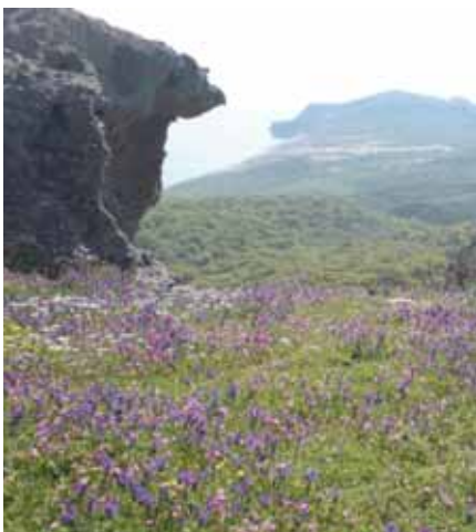
Άνοιξη στο Αλωνίτσι.

Το Ευρωπαϊκό Οικολογικό Δίκτυο Natura 2000 που δημιουργήθηκε μετά από Οδηγία της Ευρωπαϊκής Ένωσης είναι ένα πρόγραμμα για την καταγραφή, την αναγνώριση, την εκτίμηση και την χαρτογράφηση των φυσικών τόπων οικολογικού ενδιαφέροντος και των ειδών της χλωρίδας και της πανίδας. Στην Ελλάδα έχουν προσδιοριστεί και καταγραφεί 239 περιοχές που ονομάζονται Τόποι Κοινοτικής Σημασίας (Τ.Κ.Σ) με στόχο να προστατευτεί η βιοποικιλότητα, δηλαδή η προστασία της ιδιαίτερης ποικιλίας των φυτών και των ζώων αλλά και του κάλους της περιοχής ως φυσικού τόπου. Ο Άγιος Ευστράτιος η παράκτια και η θαλάσσια ζώνη του είναι πλέον μία προστατευόμενη περιοχή, ένας δηλαδή από τους 239 αυτούς τόπους. Η έκταση της προστατευόμενης περιοχής του νησιού μας έχει προσδιοριστεί μαζί με 12% θαλάσσιας ζώνης στα 6.283 ha.