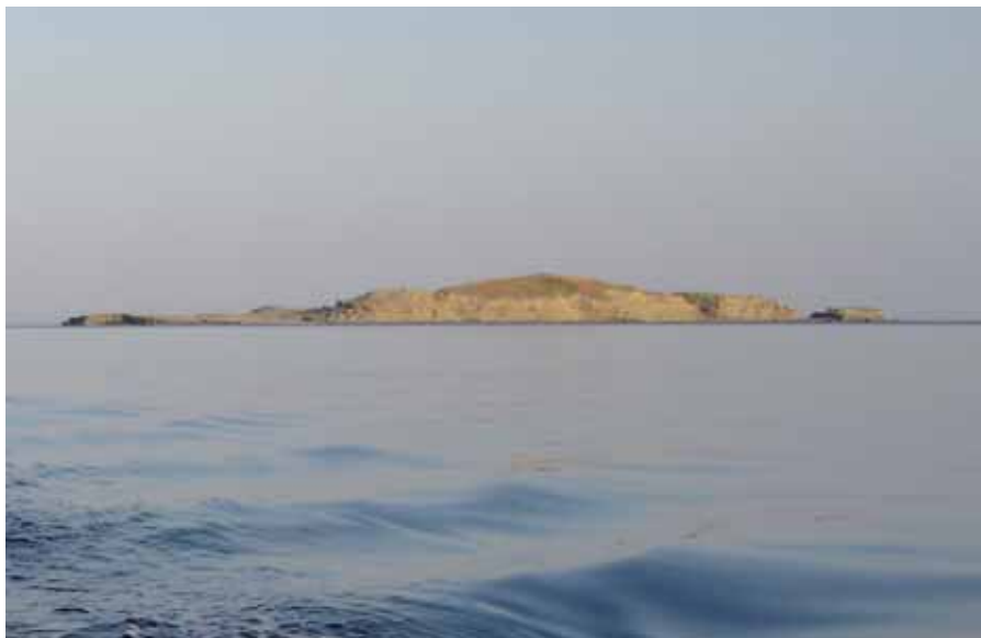
Το νησάκι Βέλια

Δηλαδή, δεν χτυπάς ψάρια, θα ρωτή-σει κανείς. Χτυπάω, αλλά πολλές φορές βουτάω και χωρίς ψαροντούφεκο, μόνο και μόνο για να απολαύσω το θέαμα και την ηρεμία του βυθού. Το να